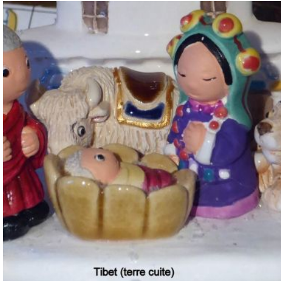
Tibet (terre cuite)